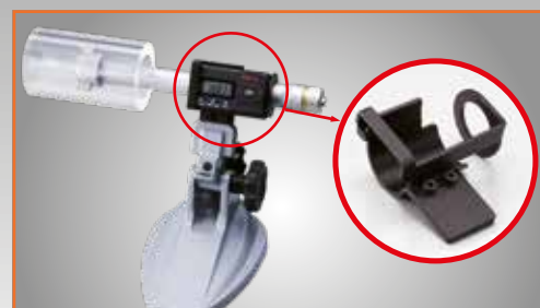
HALTER FÜR MESSSTÄNDER 04AZB157 inkl. Messständer für Bügelmessschraube 156-101-10