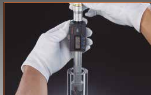
Typische Anwendung des Innenmessgerätes