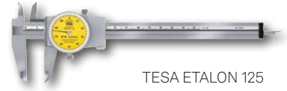
TESA ETALON 125