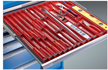
Mulden Teile für Handwerkzeuge