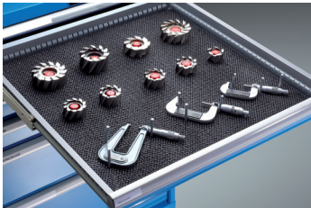
Haltestifte und Antirutschmatte