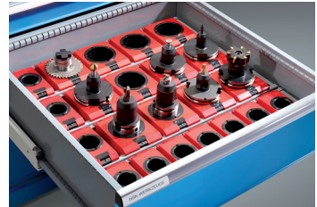
Einsatzrahmen mit NC-Halter