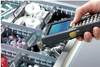
Ordnung dank Beschriftungsreiter