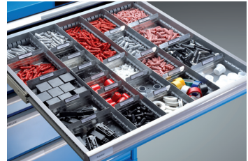
Kleinteilelagerung mit Schlitz- und Trennwänden