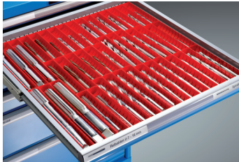
Mulden Teile für Zerspannwerkzeuge