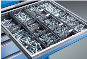
Kleinteilelagerung mit Schlitz- und Trennwänden