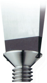
Angles saillants dans les vis à tête perdue