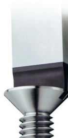
Forme adaptée du bout de tournevis PB Swiss Tools

La pointe parallèle de tournevis est une spécialité suisse. Elle ne fait pas partie des normes internationales (ISO, DIN). La régularité de la forme parallèle et les angles biseautés sont exécutés dans la plus pure tradition de précision suisse.