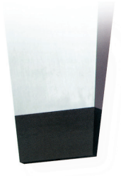
Bout ordinaire conique