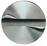
Moment de torsion, vis endommagée