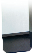
Bout parallèle PB Swiss Tools avec angles en biais