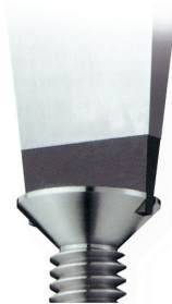
Vorstehende Ecken in Senkkopfschrauben