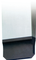
Parallele PB Swiss Tools Spitze mit Anschrägung der Ecken