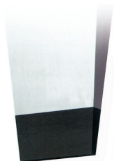
Gewöhnliche konische Spitze